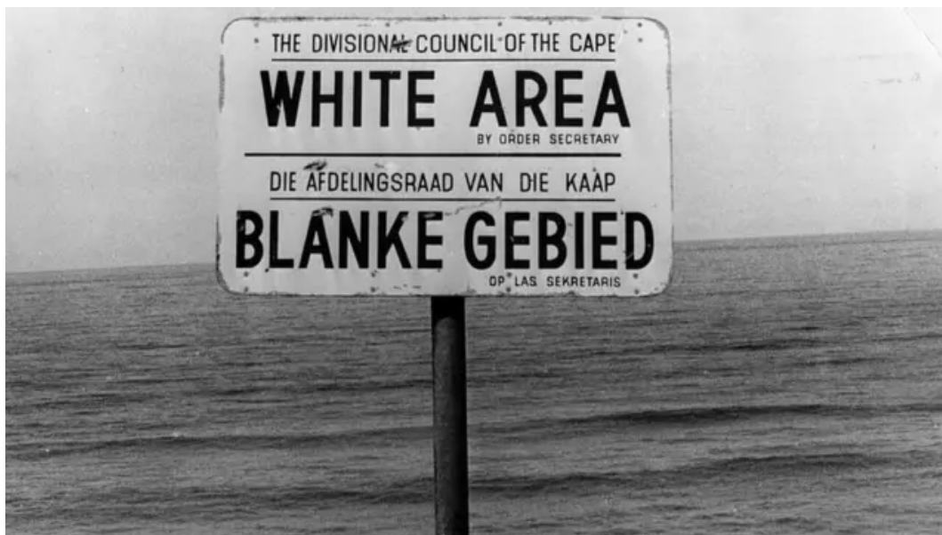
Figura 4: Fuente 1 : Letrero “WHITE AREA / BLANKE GEBIED” (zona exclusiva para blancos).

La segunda fuente elegida fue la declaración de Nelson Mandela en el Juicio de Rivonia en 1964, esta es una fuente primaria escrita que directamente expresa la perspectiva del movimiento de oposición frente a las acciones del apartheid, esta fuente es útil para analizar las transformaciones sociales en el apartheid, puesto que permite entender desde la raíz como los movimientos de oposición al régimen interpretan y responden, explica también las razones por las cuales la ANC sufrió una evolución de una resistencia pacífica a la lucha armada. Esta fuente conecta explícitamente con la guerra fría, puesto que Mandela reconoce que el ANC recibió ayuda de los países socialistas, aunque se aclara que la lucha interna de oposición no fue un proyecto socialista, sino una búsqueda de la igualdad de derechos, la fuente tiene un gran valor que permite contrastar la perspectiva del Estado, desde una visión del movimiento de la oposición, su valor histórico ofrece una visión sobre un nuevo conocimiento político sobre la sociedad, la creación del liderazgo social y el fortalecimiento de las redes internacionales para la evolución de la estructura social en Sudáfrica.