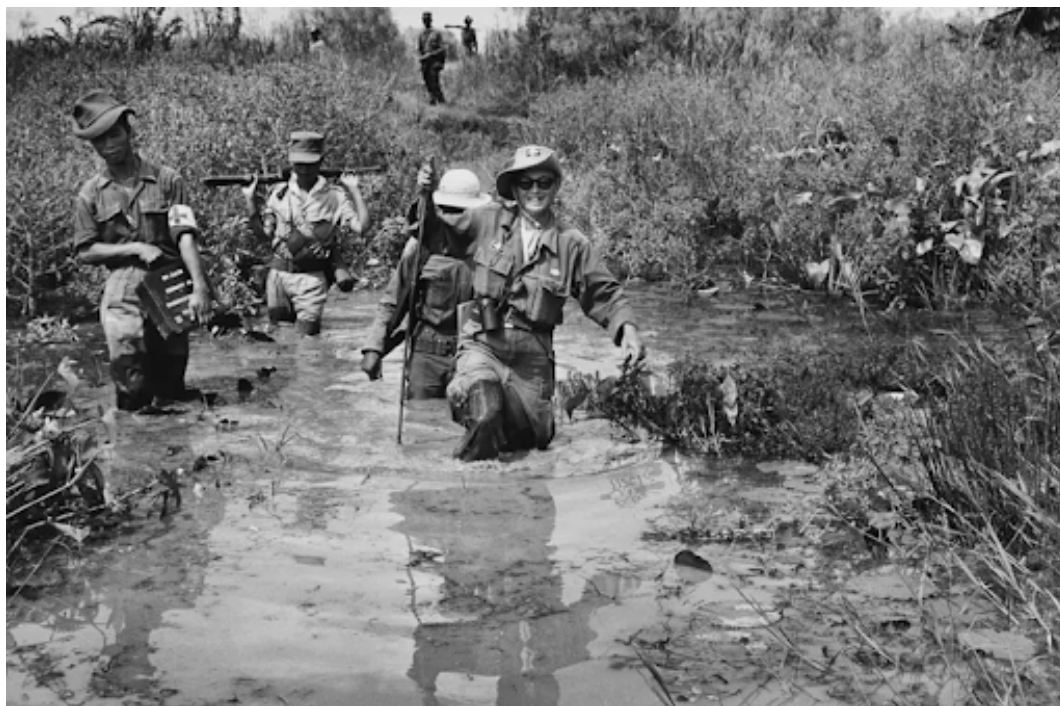
Figure 1: Un corresponsal de guerra estadounidense patrulla con el ejército de Vietnam del Sur (1962).

En el ámbito educativo, la guerra dividió al país en dos modelos opuestos. En el norte, la educación se orientó a los valores socialistas, destacando la disciplina colectiva y la formación política, mientras que en el sur se instalaron programas influenciados por Estados Unidos, centrados en la modernización y el anticomunismo. Las constantes ofensivas militares provocaron el cierre de escuelas, desplazamientos masivos y pérdida de docentes, afectando drásticamente la continuidad educativa. Tras la reunificación en 1975, el Estado vietnamita implementó reformas educativas centralizadas que buscaban alfabetizar a la población y reconstruir un sistema devastado. Estas reformas marcaron generaciones enteras y condicionaron las trayectorias laborales y profesionales posteriores (Huong and Fry 2004 ).