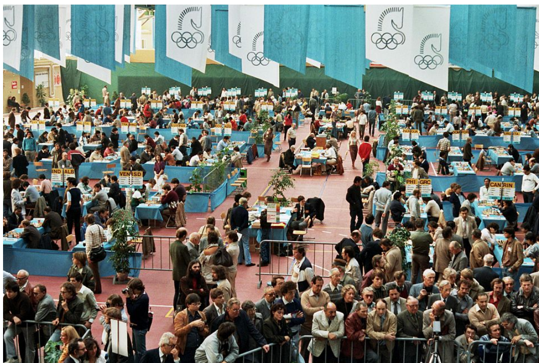
Figure 2: Imagen Olimpíadas de ajedrez 1982.